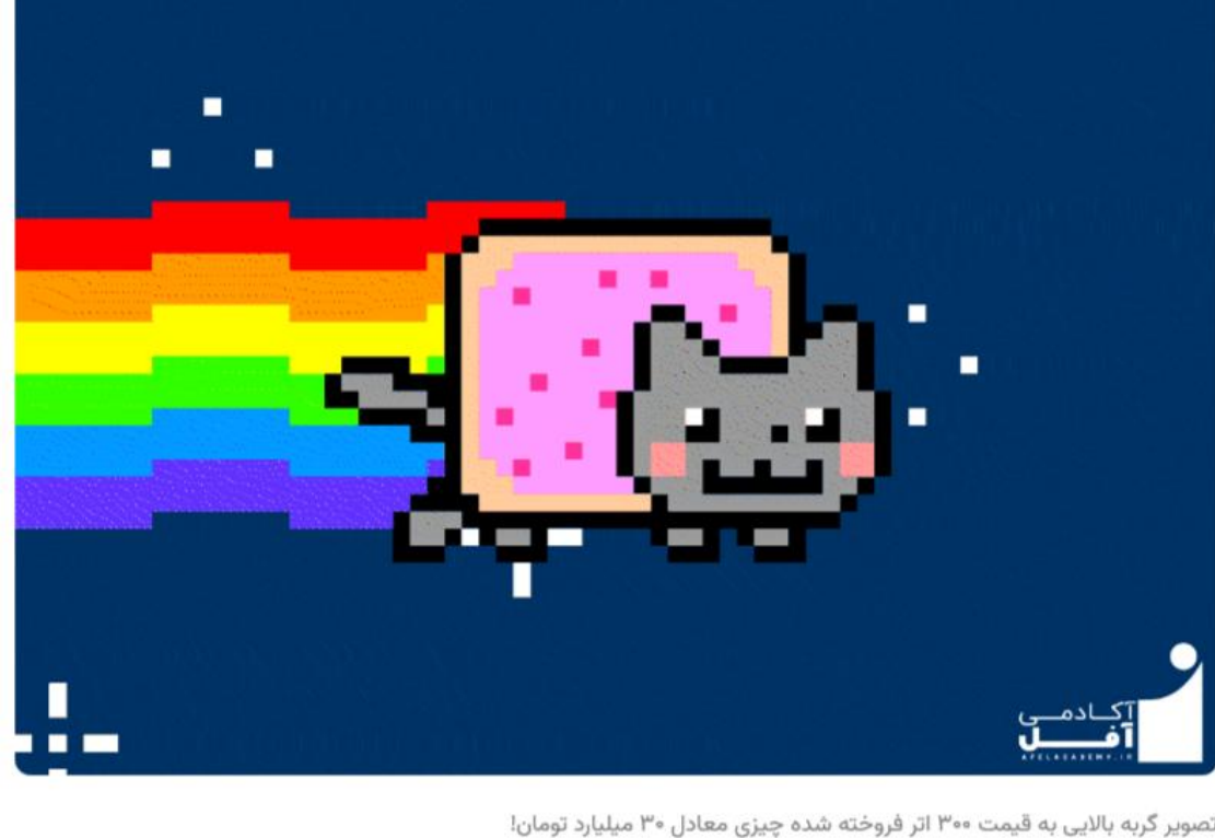
تصویر گربه بالایی به قیمت ۳۰۰۰ اتر فروخته شده چیزی معادل ۳۰ میلیارد تومان!

سؤال اصلی این است که اگر اکثر افراد می‌توانند یک یا حتی چند تصویری که ما به‌عنوان ان اف تی (NFT) خریده‌ایم را دانلود و حتی به اشتراک بگذارند.